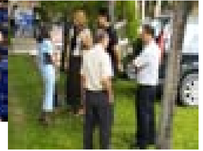
คริสตมาส